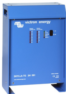
Chargeur Skylla 24 V 50 A