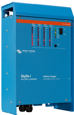
Skylla-i 24/100 (3)