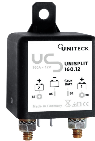
UNISPLIT 160.12 160 A-12 V Ref 0927

UNITIMER est le programmeur électronique idéal pour vos installations photovoltaïques ou réseau 12 ou 24 V. Unitimer allume et éteint vos appareils électriques 12V automatiquement et avec précision. Ses applications sont multiples : éclairage, arrosage, fontaine, préchauffage, affichage lumineux, alarme, vidéosurveillance... UNITIMER économise ainsi votre énergie pour plus d'amplitude de fonctionnement. UNITIMER possède de nombreux avantages : • plus de 17 programmes d'allumage et d'extinction possibles (week-end, journalier au choix, multi-jours...), • afficheur LCD avec cache transparent de protection, • raccordement NO ou NF (NO = normalement ouvert, NF = normalement fermé) pour plus de sécurité selon vos applications, • batterie lithium intégrée pour préserver vos programmes en cas de coupure de courant.