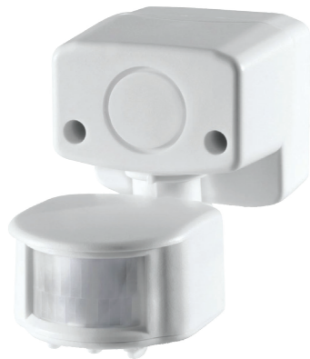
UNIDETECT 5.12 5 A-12 V Ref 1719 UNIDETECT 10.12 10 A-12 V Ref 0668