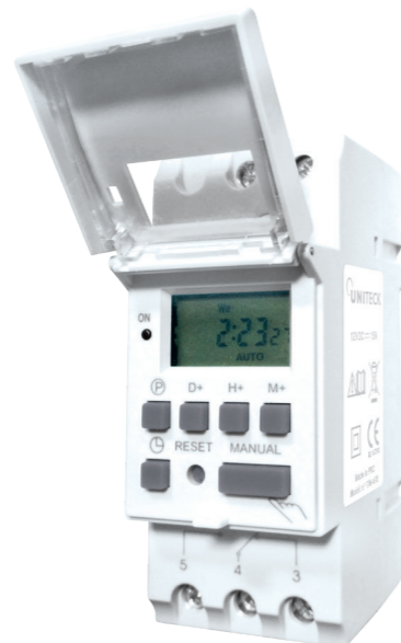
UNITIMER 16.12 16 A-12 V Ref 1221 UNITIMER 16.24 16 A-24 V Ref 1382

Idéal pour les applications de lumière, d'alarme ou de vidéo-surveillance. De technologie Infrarouge passif (PIR), il commute automatiquement votre appareil électrique 12V (ex. : alarme, spot...) de jour comme de nuit dès qu'il détecte une source de chaleur en mouvement dans son rayon d'action. Protégé contre la pluie (IP44), UNIDETECT est adapté pour une utilisation intérieure et extérieure. Il peut être fixé au mur comme au plafond. Son capteur haut de gamme couvre une grande zone avec portée de détection (120°/jusqu'à 10 mètres). Réglable pour plus de précision : • il fonctionne soit 24H/24 soit selon un niveau de luminosité déterminé, • la durée de commutation est aussi ajustable.