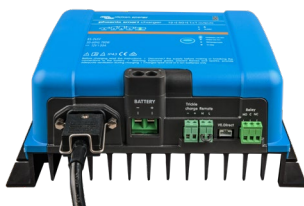
Phoenix Smart 12/50(1+1)