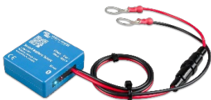
Détection Bluetooth : Smart Battery Sense