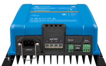
Phoenix Smart 12/50(3)