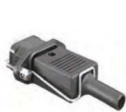
Bague de maintien (inclus)