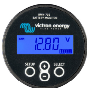
BMV 702 Noir