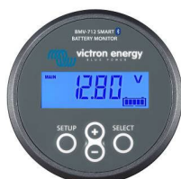
Détection Bluetooth : BMV-712 Smart Battery Monitor