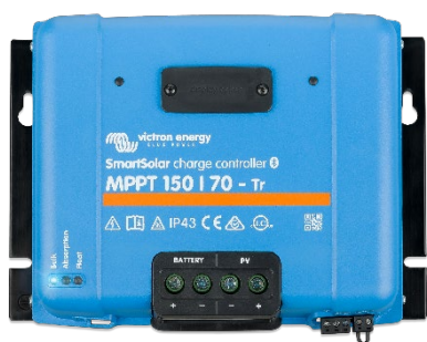
Contrôleur de charge SmartSolar MPPT 150/70-Tr sans option d'écran