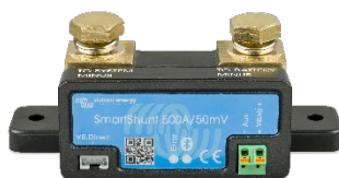
Détection Bluetooth : SmartShunt