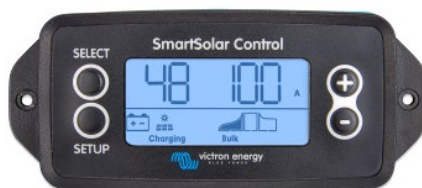
Écran enfichable SmartSolar