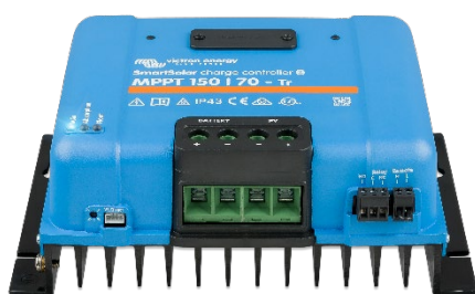
Contrôleur de charge SmartSolar MPPT 150/70-Tr sans écran