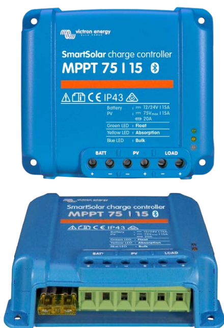
Contrôleur de charge SmartSolar MPPT 75/15