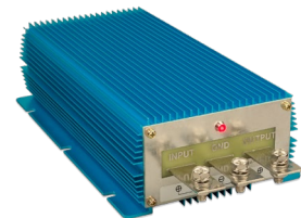
Orion IP67 24/12-100 Orion IP67 12/24-50